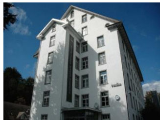
Lokal der diesjährigen Generalversammlung: Zugerstrasse 195, Neuägeri